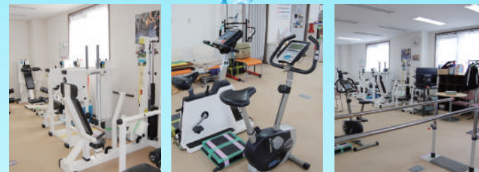
機能訓練室・相談室・静養室(各1室)

トレーニングマシン・ストレッチ台・平行棒・エアロバイク ホットパック・ストレッチボード・バランスディスク